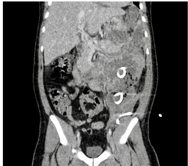
Figura 1. Tomografía de abdomen contrastada. Corte coronal. Se observan los drenajes percutáneos. Imagen propiedad de los autores.

Se realiza una TC de abdomen de control que evidencia la persistencia de las colecciones, las cuales se extienden hacia la cavidad abdomino-pélvica con múltiples septos y presencia de aire en su interior, que no han disminuido de tamaño, con catéteres multipropósito localizados en el interior. Con base en el reporte de imágenes, se decide dar manejo con necrosectomía endoscópica percutánea.