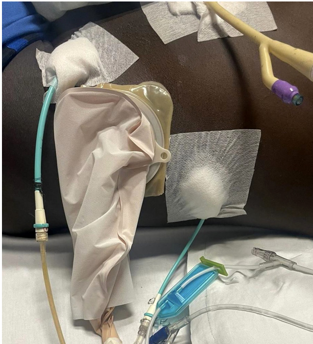
Figura 3. Se observan dos drenes cola de cerdo en el flanco izquierdo, sonda Foley en la región anterior del abdomen y puerto de trabajo para la necrosectomía endoscópica percutánea.

En la tercera sesión de necrosectomía se evidencia una disminución significativa del contenido necrótico y puru-