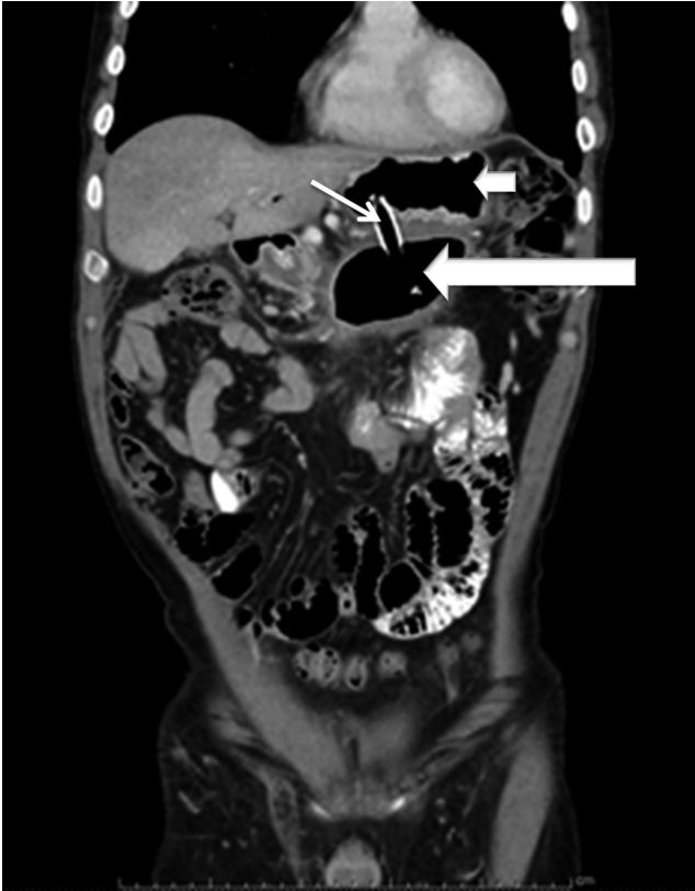
Figura 2. TAC de abdomen con contraste, control 1 semana (seguimiento al paciente de la Figura 1 ). Pseudoquiste pancreático con drenaje transmural. La flecha corta señala la cavidad gástrica, la flecha delgada señala el stent comunicando la cavidad gástrica y pancreática y la flecha larga señala la cavidad del pseudoquiste pancreático.

Según los hallazgos ecoendoscópicos, el 80% de las lesiones correspondía a pseudoquiste pancreático y el 20% a colección líquida con necrosis pancreática amurallada ( walled-off ). No hubo muertes asociadas con el procedimiento. Se realizó control tomográfico abdominal 6 semanas después del procedimiento ( Figura 3 ) en el que se evidenció una resolución completa del pseudoquiste en el 90% de los casos sin complicaciones. Todos los pacientes con cistogastrostomía resolvieron completamente la lesión, la paciente a quien se realizó drenaje por aspiración presentó recidiva del pseudoquiste a nivel del cuerpo del páncreas a las 4 semanas.