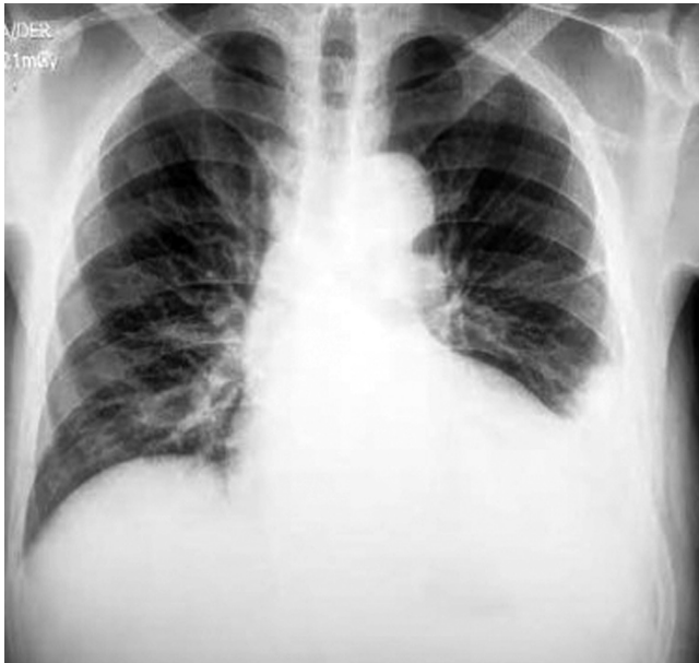
Figura 1. Radiografía de tórax en proyección anteroposterior con hallazgos de cardiomegalia, ateromatosis aórtica y obliteración del ángulo costofrénico izquierdo.