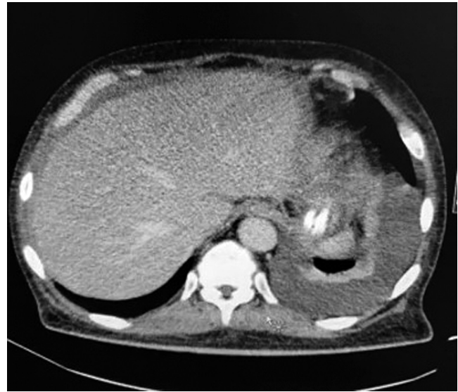
Figura 2. Tomografía de tórax simple en la ventana del mediastino con hallazgos de derrame pleural izquierdo con atelectasia pasiva pulmonar adyacente y consolidación de la llingula.

miento con meropenem en su día hospitalario 2, dado que el paciente refiere antibioticoterapia previa desconocida extrahospitalaria. Luego se realiza un estudio de líquido pleural, el cual documenta un derrame tipo exudado, con ADA negativo, hidróxido de potasio (KOH) negativo, cultivos negativos y PCR negativa para Mycobacterium tuberculosis . El bloque celular reportó abundantes linfocitos, células mesoteliales reactivas y presencia de células con núcleo grande y citoplasma abundante, con Ziehl-Nielsen (ZN) negativos ( Tabla 1 ).