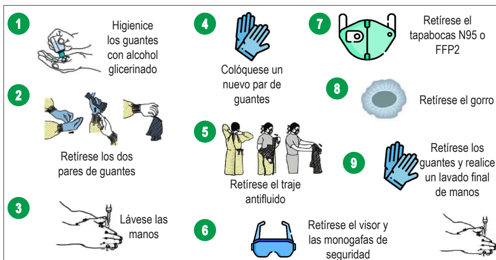
Figura 2. Paso a paso para quitarse el EPP. Modificado de: https://www.cdc.gov/hai/pdfs/ppe/ppe-sequence.pdf